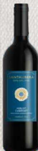
SANTA LIBERA MERLOT CABERNET CZERWONE PÓŁWYTRAWNE (WŁOCHY)

Rubinowoczerwone, intensywne od samego początku. Pikantne aromaty czarnego pieprzu, goździków i lukrecji oraz owocowe nuty jeżyn i fig uzupełnione subtelnymi akcentami gorzkiej czekolady i suszonych liści tytoniu. Na podniebieniu oferuje bardzo miękkie i jedwabiste taniny.