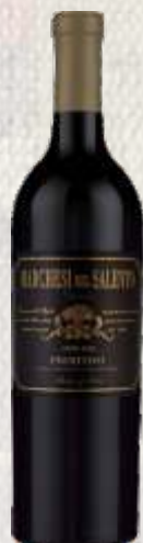
PRIMITIVO MARCHESI DEL SALENTO CZERWONE WYTRAWNE (WŁOCHY)

Wino będące kupażem dwóch doskonałych szczepów: cabernet sauvignon i tempranillo – najważniejszej czerwonej odmianie winorośli w Hiszpanii. Ma wyraźny, bardzo owocowy aromat z nutami czerwonych i czarnych owoców. Łączy nuty lekkich przypraw i tostów. Wino jest miękkie i przyjemne, a na podniebieniu są wyczuwalne taniny.