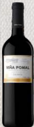
VIÑA POMAL CENTENARIO CRIANZA CZERWONE WYTRAWNE (HISZPANIA)

Wino o głębokiej, fioletowej barwie, aromacie dojrzewających w słońcu ciemnych owoców z ziołowym akcentem w tle. Jest dobrze zbudowane i krągłe. Smak tego wina to podróż od słodczy malin i śliwek, przez subtelną cierpkosć tanin, lekko wyczuwalny dąb, aż po świeży finisz. Doskonale do czerwonych mięs jak wołowina i jagnięcina.