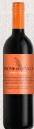
RIONE DEL FALCO ROSSO CZERWONE PÓŁSŁODKIE (WŁOCHY)

To klasyczne tempranillo ma aromatyczny bukiet ciemnych owoców i lukrecji z nutą wanilii oraz palonej kawy. Jest miękkie, zrównoważone i świeże na podniebieniu, z dobrą strukturą i łagodnymi taninami. Za swój charakter Viña Pomal Centenario Crianza otrzymało sporo wyróżnień w branży winiarskiej.