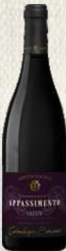
APPASSIMENTO ROSSO SALENTO CZERWONE WYTRAWNE (WŁOCHY)