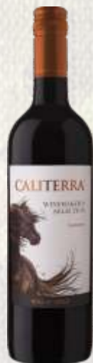
CALITERRA CARMENERE CZERWONE WYTRAWNE (CHILE)