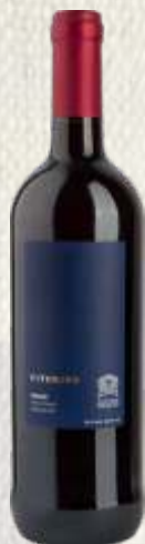
VITORINO ROSSO CZERWONE PÓŁWYTRAWNE (WŁOCHY)

Winogrona szczepu primitivo dają intensywny ciemny kolor trunku. Charakteryzuje się niską kwasowością, łagodnymi taninami i miłą słodyczą owocu. Można w nim wyczuć intensywne nuty przypraw i żurawiny. Tak bogate wino powstaje w rodzinnej winnicy Castellani z winogron dojrzewających na tokańskich wzgórzach Pizy.