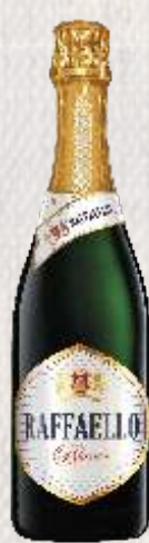
RAFFAELLO BIAŁE SŁODKIE (POLSKA)

Dojrzałe, eleganckie wino o delikatnie, winnym bukiecie i wytrawnym smaku. Najbardziej znane niemieckie wino musujące, wiodące w segmencie produktów markowych.