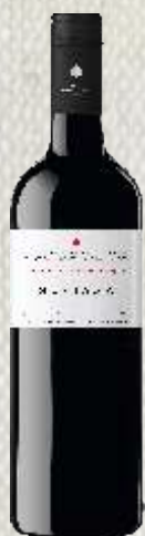
NUVIANA TEMPRANILLO/CAB. S. CZERWONE WYTRAWNE (HISZPANIA)