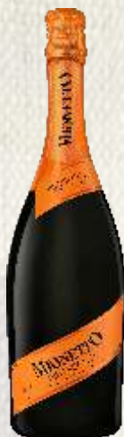
MIONETTO PROSECCO BIAŁE WYTRAWNE (WŁOCHY)