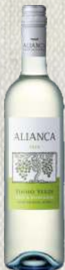
VINHO VERDE ALIANCA BIAŁE PÓŁWYTRAWNE (PORTUGALIA)