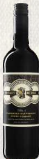
CACADU RIDGE CAB. SAUV. CZERWONE WYTRAWNE (AUSTRALIA)

Appassimento Rosso Salento powstaje ze szczepów primitivo i negroamaro, stąd głęboka, rubinowo-fioletowa barwa. Jak na włoski temperament przystało, wino jest intensywne i wyraziste, ze zdecydowanym bukietem dojrzałych śliwek i winogron. Bogata tekstura kryje smak dojrzałych owoców, suszonych fig, przypraw i tytoniu.