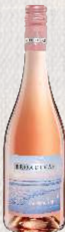
BROADLEAF ROSE RÓŻOWE WYTRAWNE (RPA)

Przyjemne i lekkie Santa Libera bazuje na szczepach Merlot i Cabernet Sauvignon. Ma owocowy aromat z akcentem czarnej porzeczki, owoców leśnych i delikatnej szczypty przypraw korzennych.