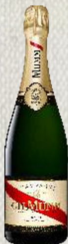
MUMM BRUT SZAMPAN WYTRAWNY (FRANCJA)