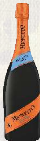
MIONETTO ALCOHOL FREE 0,0% BIAŁE BEZALKOHOLOWE (WŁOCHY)

Prosecco DOC to wysokiej jakości wino musujące wytrawne, które wyróżnia się żółtym słomkowym świetlistym kolorem, intensywnymi i delikatnymi bąbelkami, owocowym aromatem jabłek odmiany golden, smakiem lukrecji, jabłek i akacji.