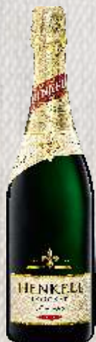
HENKELL TROCKEN BIAŁE WYTRAWNE (NIEMCY)